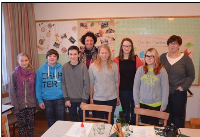
Die Firmgruppen bei ihrer ersten Heimstunde im Pfarrheim mit ihren Firmbegleitern.