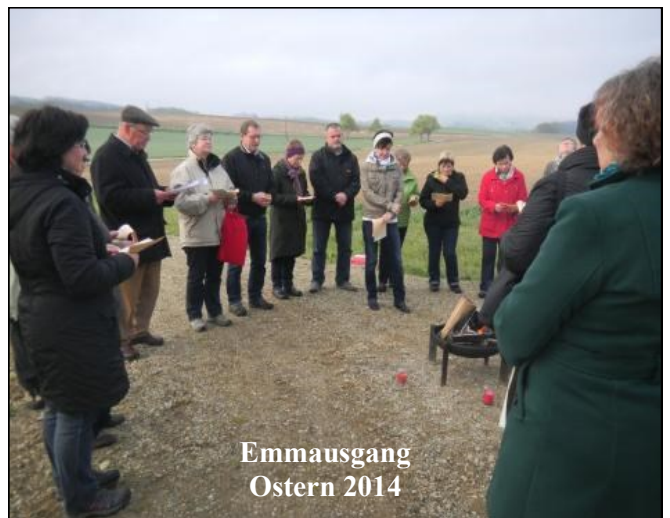
Emmausgang Ostern 2014

6. April 2015, um 6:30 Uhr beim Pfarrheim und gehen pünktlich um 6:45 Uhr los. Der Emmausgang umfasst verschiedene Stationen, die leicht zu bewältigen sind. Die Zeit ist so gewählt, dass wir gemeinsam um 8:30 Uhr den Gottesdienst in der Pfarrkirche mitfeiern können. Die Worte aus dem Lukasevangelium „Brannte uns nicht das Herz?“ werden uns begleiten.