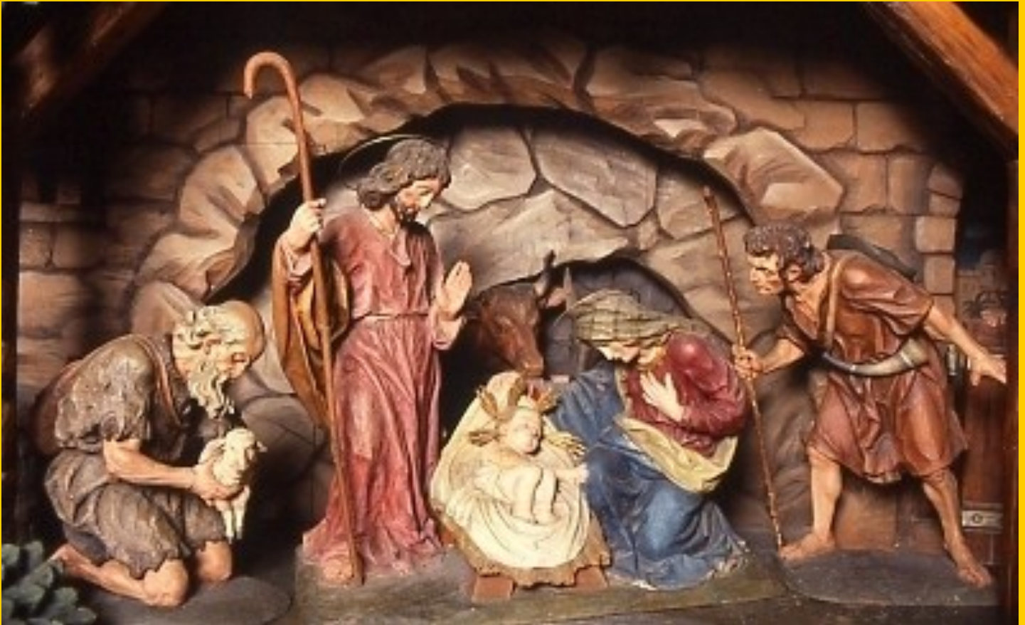
Weihnachtskrippe in der Pfarrkirche Gaspoltshofen